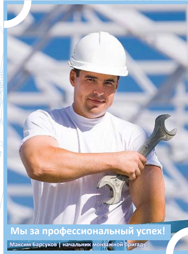
Мы за профессиональный успех!

Кроме монтажа, а также выполнения функций генподрядчика, строительно-монтажное подразделение БМК осуществляет антикоррозийную защиту конструкций до и после монтажа. Все виды работ ведутся с использованием парка грузоподъемной техники БМК. Элемент за элементом, конструкция за конструкцией, уровень за уровнем — так рождается надежный и прочный каркас объекта — стальная опора, которую предлагает Вам БМК.