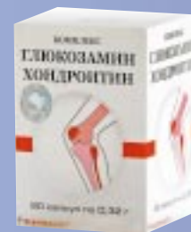
РЕКЛАМА. ТОВАР СЕРТИФИЦИРОВАН

«Глюкозамин Хондроитин комплекс» не имеет противопоказаний, кроме индивидуальной непереносимости