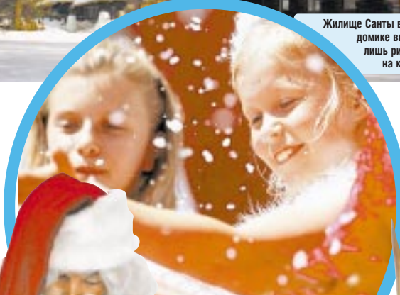
В этой книге — самые послушные дети в мире

Атмосферу праздника в деревушке Санта-Клауса дополняет рождественский сюрприз в виде северного сияния (не забудьте загадать желание!). Дело в том, что декабрь и январь в Финляндии — это время «каамос» (то есть полярной ночи), когда солнце не встает из-за горизонта и 22 часа в сутки царит ночь. Температура может опускаться до -45^{\circ}\text{C} , хотя обычно на родине Санта-Клауса стоят 10-20 -градусные морозы.