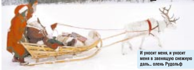
И уносит меня, и уносит меня в звенящую снежную даль... олень Рудольф