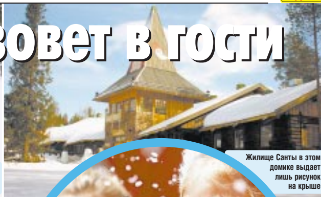
Жилище Санты в этом домике выдает лишь рисунок на крыше