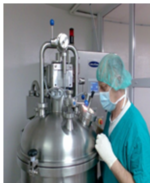
В лаборатории «NANTES» РНП – Реактор Низкотемпературной Плазмы

Достоверно установлено, что излучение РНП обладает не просто стимулирующим, а нормализующим структурно-функциональным состоянием на лимфоциты и лейкоциты человека.