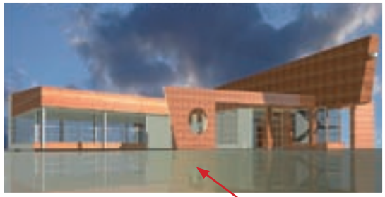
Физкультурно-оздоровительный комплекс (бассейн)